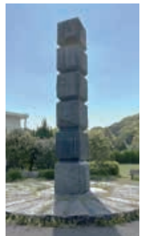
市民憲章碑（延命公園内）

現在は移設作業を終え、延命庁舎敷地内に仮置きしています。総合体育館の竣工に合わせて、令和5年度末に延命公園内への再設置を予定しています。