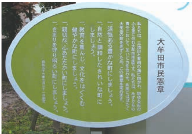
市民憲章碑（市役所玄関前）