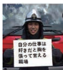
職種【消防】 令和2年度入庁

子ども家庭課で子育て支援を担当しています。専門用語や制度を覚えるまでは苦労もありましたが、やりがいのある業務です。一方で、趣味などを楽しむプライベートの時間も充実しており、ワークライフバランスも実現できています。