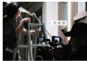
スタッフの皆さんによる 細かなチェックが入ります

姿を見ることができました。さまざまな角度から同じシーンの撮影があるため、何度も同じ台詞や動きをされている俳優の皆さん。監督の声で一気に現場の空気が変わり、カットがかかれば、それぞれ動くスタッフの皆さん。こんな風に映画が撮影されているんだなと素敵な現場で取材できたことに感謝です。 大牟田の風景がどのように映っているのかとても楽しみです。ぜひ皆さんも、映画館へ!