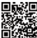
こちらからも申込み可!