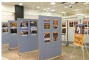
イオンモール大牟田での パネル展