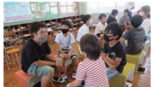
英語で友達にインタビュー、もちろん回答も英語で