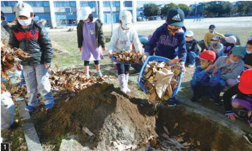
1 校内の落ち葉と米ぬかで腐葉土づくり(2年生)