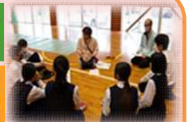
1年 高齢者福祉学習