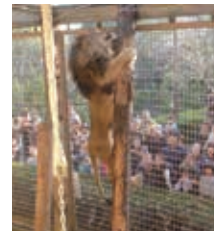
木の上に肉を置くことで、木に登るという行動が引き出されるほか、爪が研がれるなどの効果があります

動物たちが心身ともによりよく生活できるように環境を豊かにするための工夫のことで、野生下で行っている多様な行動ができる環境づくりや、食べ物を日々違う大きさに切ったり、置く場所を変えたりするなど、さまざまな工夫を行っています。