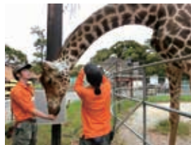
キリンが頭を下げた状態を維持してくれることで、採血が可能になります

動物の心身の健康管理など、飼育上必要な行動を動物たちに協力してもらいながら行うトレーニングをハズバンドリートレーニングといいます。トレーニングを行うことで、定期的な検査による病気の早期発見や効率的な治療を行うことが可能になります。