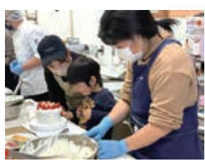
バースデーケーキ作り