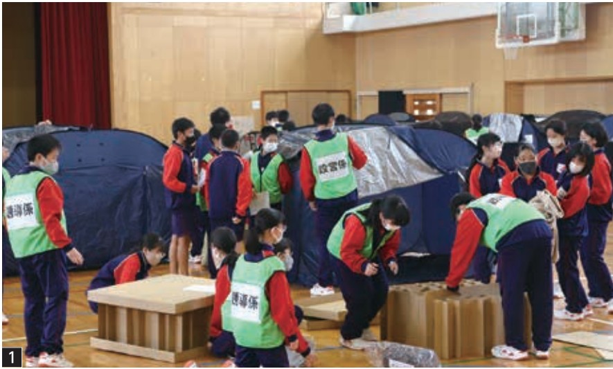
1 協力して避難所の設営を行いました