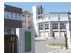
生徒数 496 人 (令和5年1月1日現在)

こうした学習を通して、思いやりの心を持ち、未来を生き抜くための力を身につけてほしいと願っています。