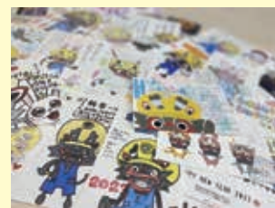
ジャー坊が一枚一枚じっくり読みました