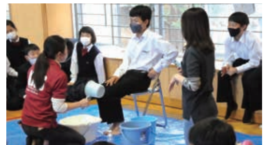
被災地で提供されている足湯を体験

平成 27 年度に船津中、右京中、延命中が再編統合した学校です。近隣に市民体育館や図書館、記念グラウンドなどの公共施設があり、教育環境に恵まれています。