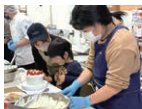
バースデーケーキ作り