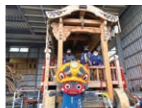
大蛇山に触れてみよう