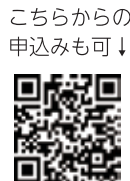
こちらからの申込みも可↓

▼入場料 無料(要事前申込) ▼申込み・問合せ 健康づくり課 (☎412668)