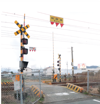
3人が助けた船津町の踏切

3人は修学旅行を楽しみにしており、5月に実施される測量士補の国家試験に向けて勉強にも取り組んでいます。