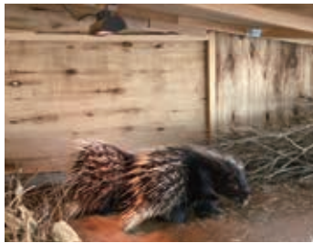
暖かな部屋で過ごすヤマアラシ