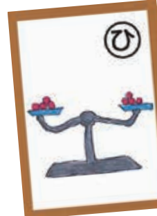
すべての人が平等だったら、けんかがなくなると思う