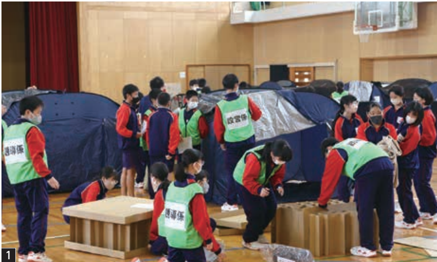
1 協力して避難所の設営を行いました