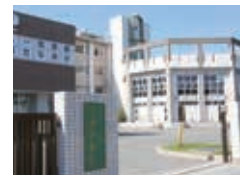
生徒数 496 人 (令和5年1月1日現在)

こうした学習を通して、思いやりの心を持ち、未来を生き抜くための力を身につけてほしいと願っています。