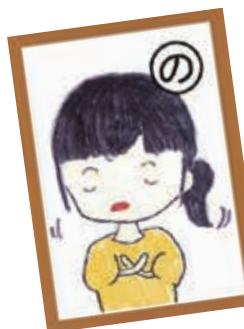
いやなことはいやと、自分らしくいられたらいいな

大牟田市で活動しているガールスカウトの皆さんが、男女共同参画について学習し、かるとを作りました。今回は、シニア部門(中学生)の作品を紹介します。