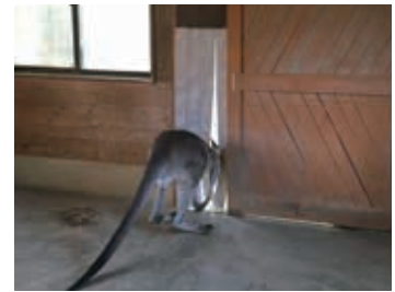
カーテンから顔を出すカンガルー