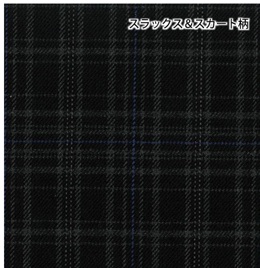
スラックス&スカート柄