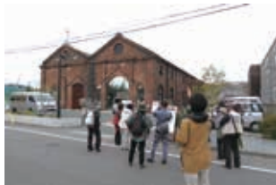
令和4年3月の開催時の様子

大牟田観光プラザ ☎52-2212 FAX43-0100 🗓毎週月曜日(祝日の場合は翌日)