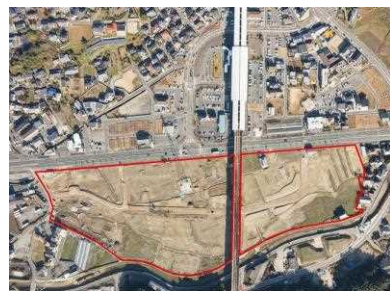
※新大牟田駅産業団地整備予定地