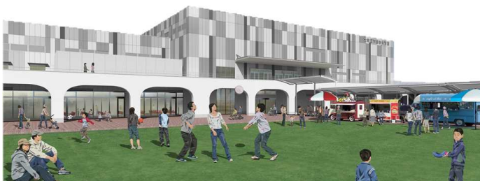
※総合体育館イメージ

(総合体育館整備事業R5:1,828,861、延命公園整備事業R5:116,600、延命公園周辺道路改良等事業R5:98,000、(再掲)動物園機能強化事業R5:110,414)