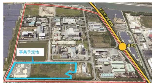
※新たなごみ処理施設整備予定地