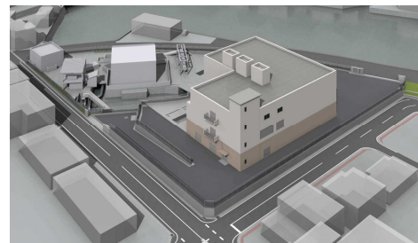
※三川ポンプ場イメージ

(手鎌野間川河川改良事業R5:22,800、雨水調整施設整備事業R5:300,000、ため池整備事業R5:100,000、道路新設改良事業R5:231,500、河川等浚渫R5:67,000、都市下水路改良事業R5:60,000 ほか)