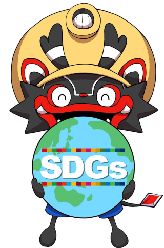
大牟田市公式キャラクター 「ジャー坊」