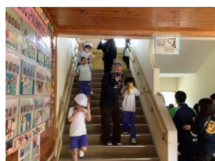
大牟田特別支援学校

地震や火事起きた時を想定し、避難経路の確認をしたり、安全な避難の仕方を学習したりしました。