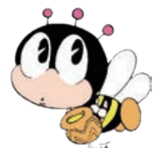
生涯学習のマスコット 「マナビ」