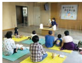
昨年イベントの様子