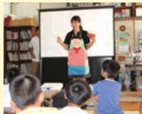
久留米ヤクルト販売(株) 「ウン知育教室」