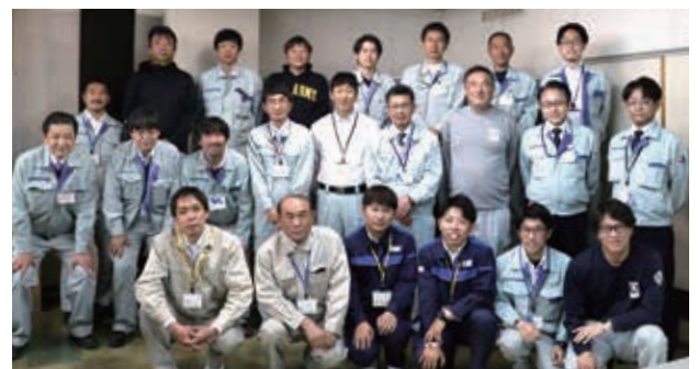
災害復旧対策室で記念撮影（令和5年3月31日）

福祉ボランティア団体「よろずボランティアいちたすいち」が、県内でさまざまな地域づくり活動に貢献している団体を表彰する同賞を受賞し、市長に報告しました。サンタクロースに扮し高齢者世帯を訪問しプレゼントを贈る活動や、災害支援等の活動が評価されました。