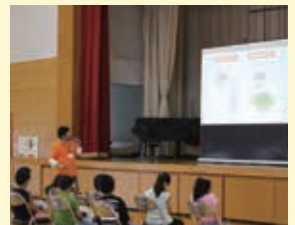
(株)マルエ産業 「親子で学ぶ キッズマネースクール」