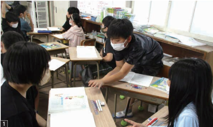
1 机を寄せ合い、互いに考えを伝え合う子どもたち