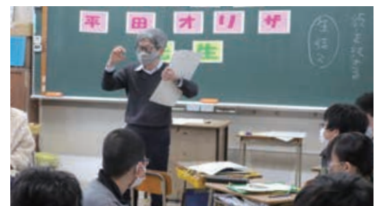
平田オリザさんからコミュニケーションの大切さを学ぶ