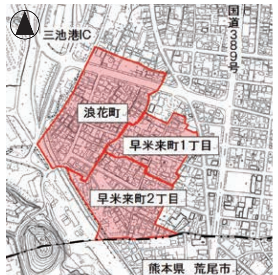
令和5年度現地調査区域（予定） 浪花町、早米来町1丁目・2丁目

また、現地調査区域および閲覧区域の土地所有者の皆さんには、実施時期について郵送により通知します。