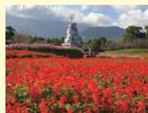
有明の森フラワー公園