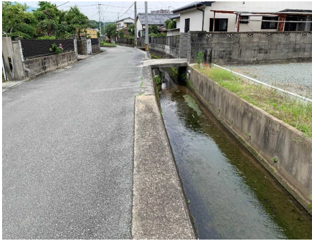
歴木岩ヶ下団地付近の水路