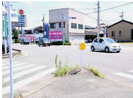
日の出町ローソン付近の交差点