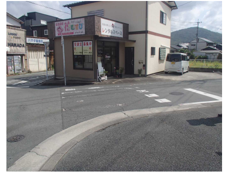
高泉団地付近の高泉橋