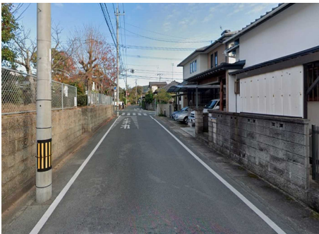
桜台公園付近の道路