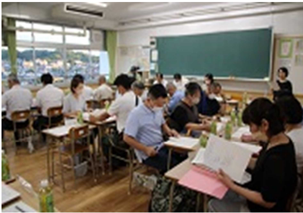
改修済み教室での会議