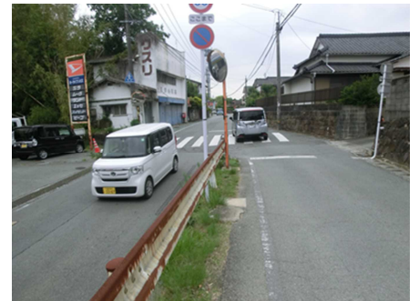
県道大牟田高田線と市道櫛野今山線の合流地点