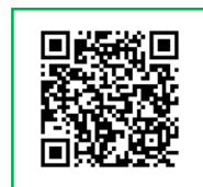
ぴったりサービス (電子申請)

申請者情報を入力して、各種届出書の データをアップロードするだけで届出完了です。 申請情報を保存すると次回申請時にその情報を利用できます。