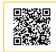
大牟田市消防本部 HP (申請方法説明)