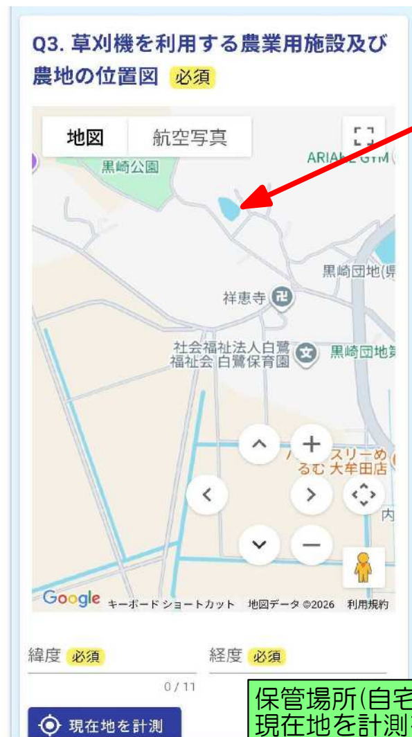
拡大・移動した地図