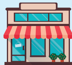
個人経営のお店 (飲食店など)