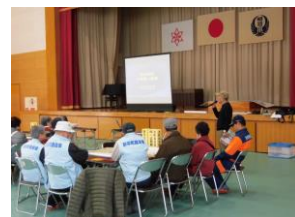
明治校区災害図上訓練