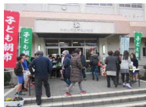
手鎌校区子ども朝市