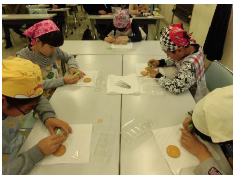
アイシングクッキーに挑戦しました

子どもたちが将来の自分を考えるヒントとなることを目的として、職業に就いている大人が講師となり、その職業に就いた経緯や努力したことなどを子どもたちに伝える講座です。後期の3講座を実施しました。どの講座も、子どもたちの目の輝きが印象的でした！