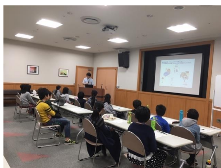
臨床検査技師の方から話を聞きました