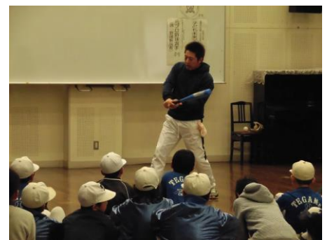
講話も実技もためになりました