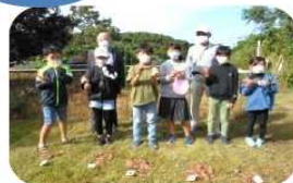
さつまいもの収穫