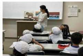
小学校カヌー教室では、生物教室や読み聞かせも実施