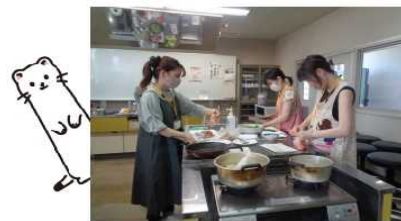
食べて、笑って、つながる！子育て講座

“つながる”をテーマとして、子育て中の方向けに離乳食づくりやトーク会を行いました。