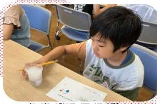
わくわく「ドライアイス実験」

夏休みを利用し、実験や工作を楽し みながら体験することで「観察力」や 「考える力」を育む講座を開催してい ます。