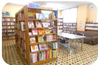
新刊もたくさんあります

約 1 万冊の本が揃っていて、 閲覧や貸出しができます。児童 図書のコーナーもあります。