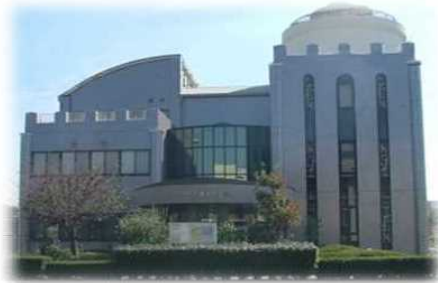
展望台のある 「有明海」をテーマにデザインされた建物