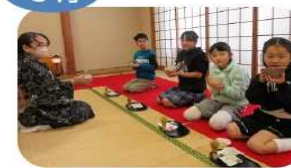
春の子どもお茶会