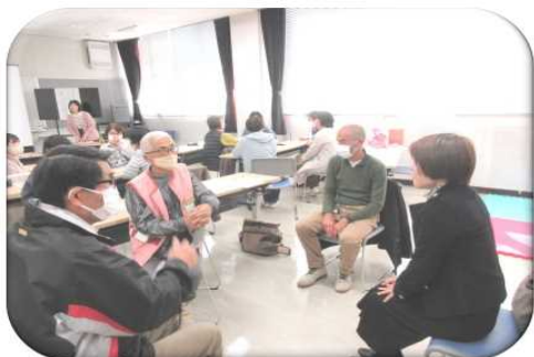
子どもを取り巻く環境について学ぶ参加者

子どもの社会的自立と、保護者が子育てを通じて自らの人生を豊かなものにするために役立てていただけるよう、家庭教育に関する講座を実施しています。