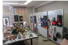
卓球、水彩画など23の定期登録サークルが活動中