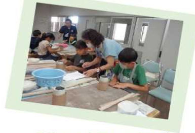
夏休みの宿題おたすけ隊