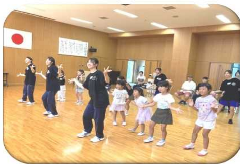
LET'S DANCE TOGETHER

令和6年度はありあけ新世高校ダンス部員による小学生を対象としたダンス講座を実施しました。異なる世代の人と交流することは、子どもの社交性や対人能力を伸ばすことにつながります。