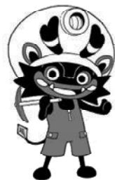
大牟田市公式キャラクター 「ジャ-坊」