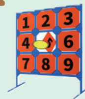
ディスゲッター・ナイン