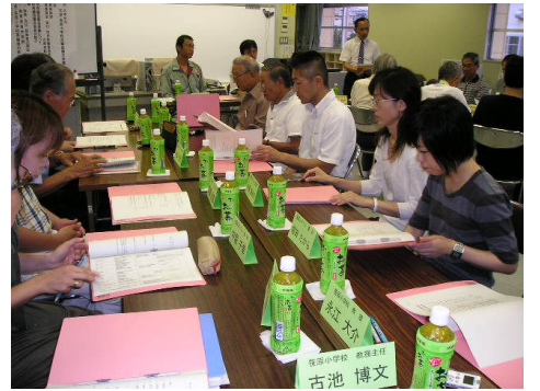
学校再編協議会の協議風景