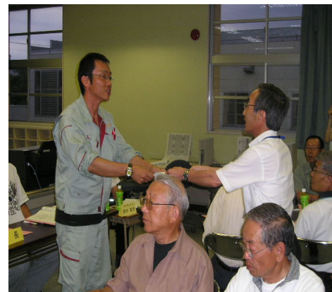
教育長から協議会長への諮問

新校の学校名諮問理由 学校は、児童の人格の形成を期すとともに、地域社会の生活・文化・教育の向上に大きな役割を担っています。したがって、新しい学校には、地域社会の形成の拠点となるふさわしい学校名を定める必要があります。なお答申に当たっては、地域の意見が充分反映されるようお願いいたします。 <教育委員会>