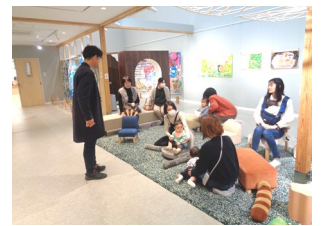
ともだちや絵本美術館 岡館長