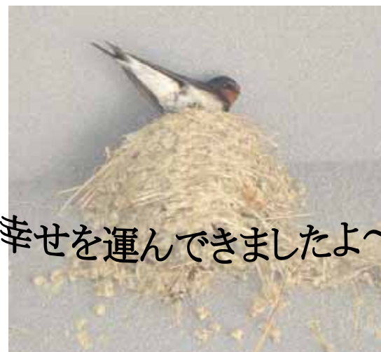
幸せを運んできましたよ～

“みんなが集う”三川地区公民館につばめがやってきたということは・・・地域みなさんに幸せが訪れるということですね!!この『みかわ地域だより』にも、みなさんの幸せを載せていきたいと思ひます。よろしくおねがいします