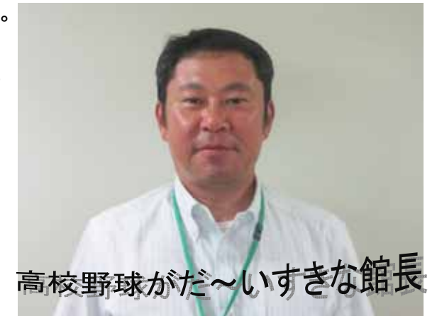
高校野球がだ～いすきな館長