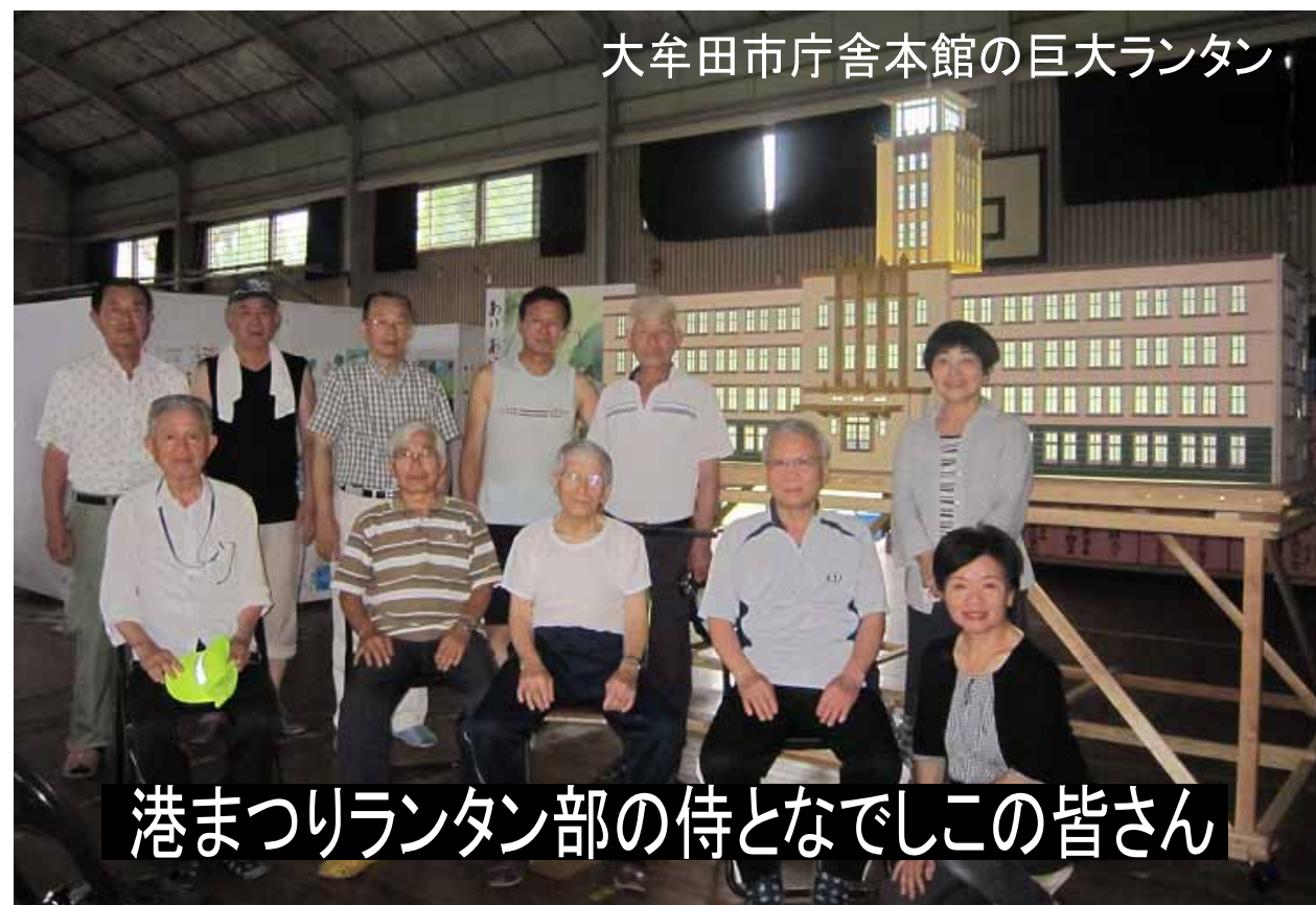
大牟田市庁舎本館の巨大ランタン