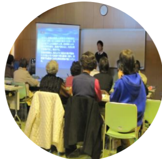
第1回 安心安全課職員による防災について(講話)