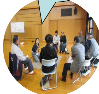
第2回 消防署職員によるAEDの説明と実習