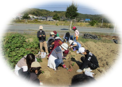
利用サークルの協力により、近くの畑で芋掘り。