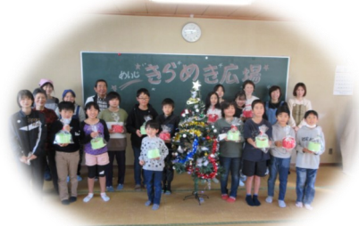
明治会館にて、みんなでケーキ作り。