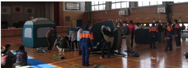
↑ 明治校区避難訓練

手鎌地区公民館は、手鎌校区・明治校区の2校区を担当しています。地域の行事やイベントを年間通してご紹介します。