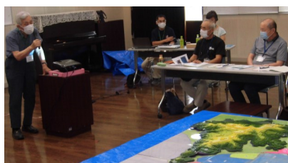
模型を使って干拓のあゆみを学びました

受講生は手鎌の歴史への関心が高く、座学で学んだことを自分の目で確認することができてよかったと好評でした。