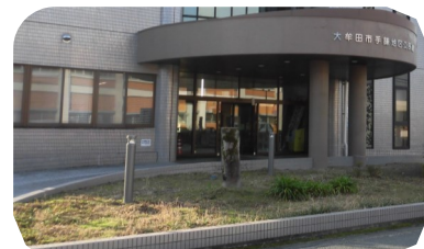
玄関前がきれいになりました