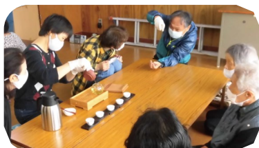
サロンの皆さんに癒しをお届けしました

中国茶の効能や淹れ方を学び、おもてなしの実習を行った受講生14人。日本茶とは違う作法に初めは戸惑っていた受講生も、徐々に落ち着いた気持ちでお茶を淹れることができるようになりました。