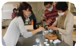
基本の淹れ方を学びました

サロンに癒しを届けよう～“中国茶”でボランティア～（10月2日～11月20日 全5回実施）