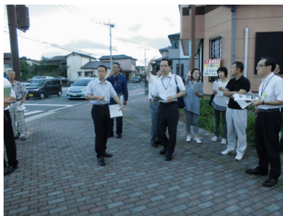
（末広町交差点付近）