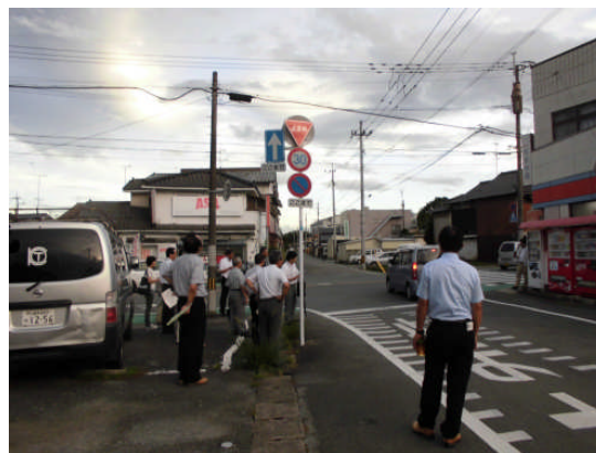
（県道藤田上官線一方通行出口付近）

※上記の場所以外にも、3ヶ所意見が出ましたので現在調査検討中です。（第5回で回答）