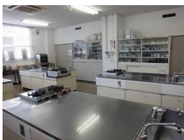
勝立地区公民館 料理室

勝立地区公民館の料理室は、クロスを張り替え、明るくきれいになりました！イスや食器棚も老朽化してありましたので、新品ではありませんが使いやすいものに入れ替えました。ガスオープンも2台あり、パン作りやお菓子作りにもご利用いただけます。ぜひ、料理室を利用してみませんか♪