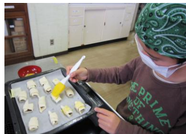
お菓子作りもできますよ☆