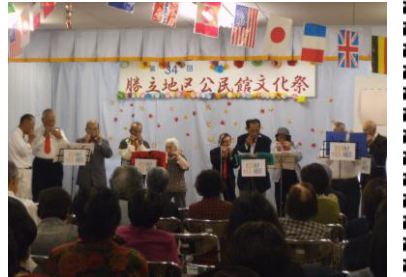
去年の文化祭の様子

※内容については、変更になる場合があります。詳しくは後日配布の文化祭チラシでご確認ください。