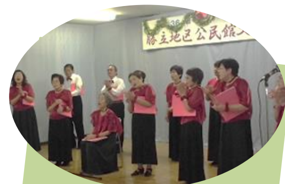
昨年の演芸発表の様子

ご自分の作品を文化祭で展示してみませんか! 手作り小物や絵画、写真など、なんでもOKです。 ※詳しくは、公民館までお問い合わせください。 ◆申込み・問合せ 勝立地区公民館(51-0393)