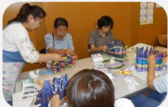
マイバックの完成までもう少し!