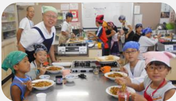
デイキャンプで焼きそば作り