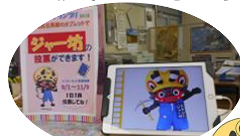
事務室カウンター