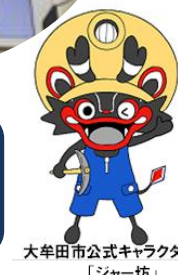
大牟田市公式キャラクター「ジャー坊」