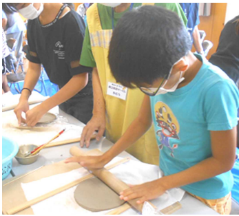
粘土をのばす成形の工程

「おもしろ科学」に挑戦しました！ 今年の勝立キッズ・ランドは「おもしろ科学」をテーマに身近な物に潜む不思議について調べる実験や工作にチャレンジしました。3年生から6年生までの児童17人は「陶芸の不思議」でマグカップと皿、「科学の不思議おやつ」で電気パンやべっこう飴などを作りました。 また「からくりの不思議」では江戸時代から伝わる伝統的なおもちゃ「板返しからくり」に挑戦し、完成にたどりつくまでのからくりの発見に悪戦苦闘しながら作り上げました。