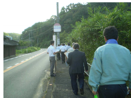
↑ 勝立中校区内の視察

新校の開校までに一定の安全対策を実施していただくために、視察結果をもとにまとめた要請書を危険箇所を管轄している3つの関係機関に提出します。