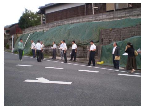
↑ 米生中正門東側三叉路付近の視察