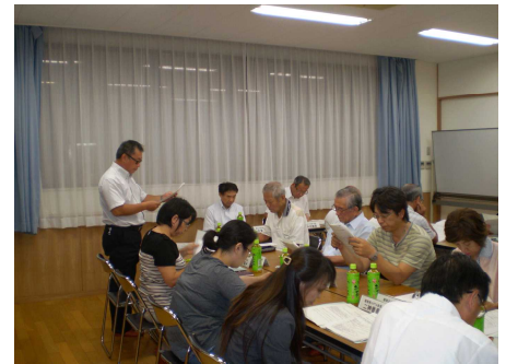
↑ 施設設備の要望事項の説明