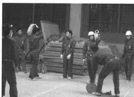
ホース運びや動作の確認