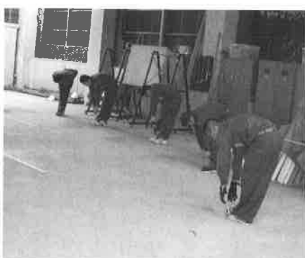
練習前の準備運動