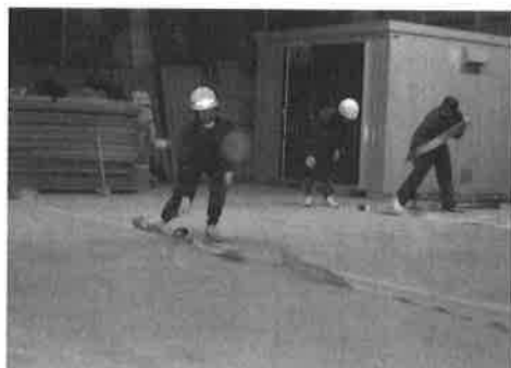
ホース延長の実践練習