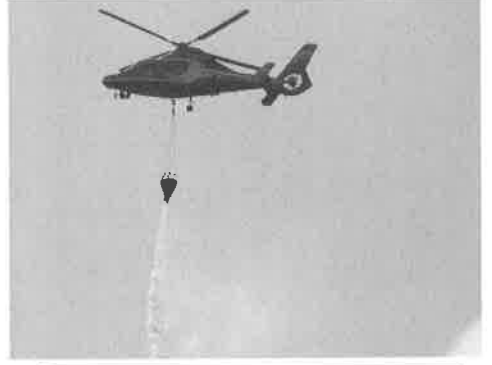
ヘリコプターからの放水訓練

平成26年3月2日(日) 9時から11時において大牟田市消防署・消防団合同で、大牟田市歴木の平野山団地第一公園周辺で山林火災を想定した訓練を実施しました。そこではデジタル簡易無線機を初めて使用し、現場本部の設置から、ホース延長・放水などの一連の手順を迅速に行いました。また、空中からは福岡市消防局航空隊のヘリコプターが約600ℓの水を一気に火元と設定された場所へ放水しました。