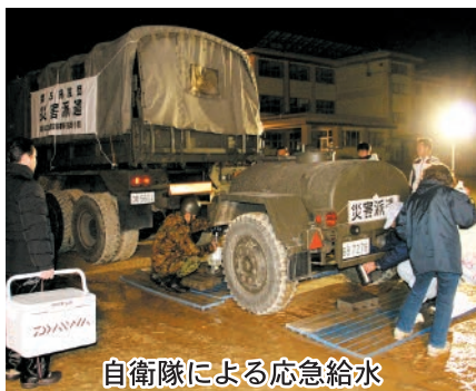
自衛隊による応急給水

具体的には、平成28年熊本地震の概要や市の対応、寒波による全市の緊急断水の経過と市の対応などについて報告します。