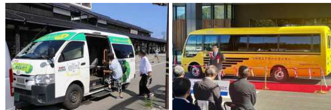
▲各地の取組例 左：被災地へのデマンド交通導入（石川県輪島市） 右：交通結節点からの「観光の足」確保（熊本県人吉市～鹿児島県霧島市）